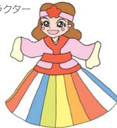
いせりのミライちゃん